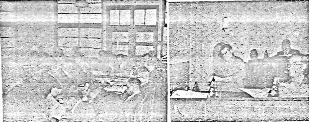
(写真説明 全員協議会) (本会議に於ける須藤区長)

三月二十九日本会議前に全員協議会が開かれ本会議上提の報告三件議案十四件につき協議し終つて午後七時十五分本会議に入り須藤区長の談話