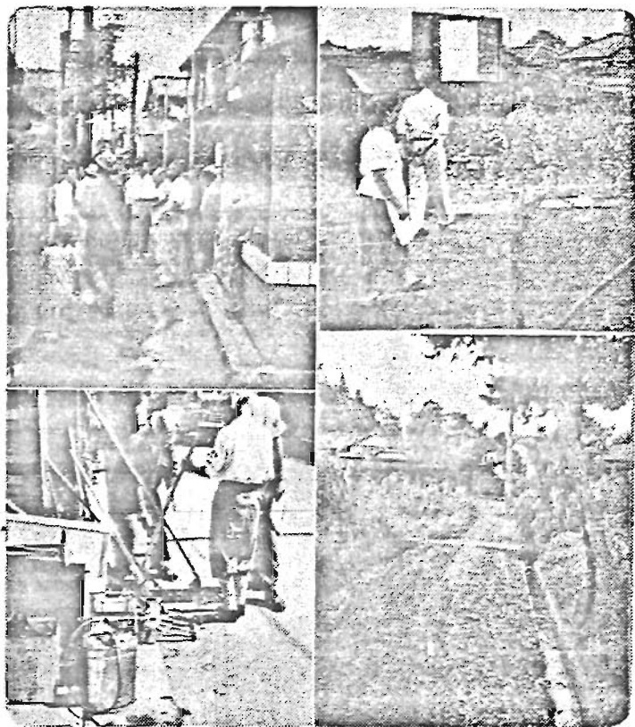
視察の除芥区、掃腹接、地区大隣、地目と、丁区目、一丁目、町目三、南五、田五、高池長、上下左右、左左右

衛生豊島区確立の基盤として、衛生モデル地区を設け、六月発足以来、地元民は勿論、衛生相諮員及び地区委員、同協力員の絶大な御協力により、多大の効果を挙げ得たことは、前号詳述の通りであるが、発足以来四月に亘つて挙げ得た各衛生モデル地区の成果の實際を、目で見、耳