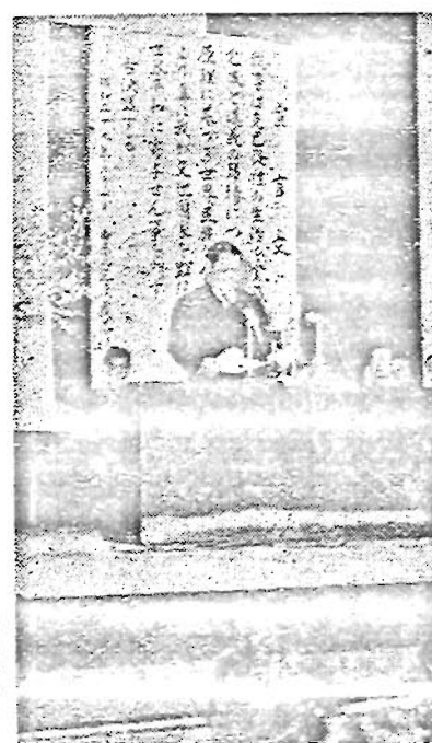
写真 上 おこたを述べられる高松宮殿下 説明 下 挨拶する須藤区長