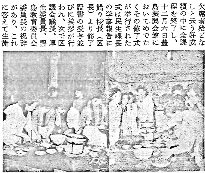
いたのが注目された。 修了者は三八四名であつた。

去る十月十七日より開設されてきた才九期豊島区成人職業学校は連日欠席者殆どなくと云う好成绩の中に全課程を終了し、十二月六日豊島振興会館においてめでたくその修了式が挙行された。式は民生課長の学事報告に始まり校長(区長)より修了證書の授与並びに挨拶が行われ、次で区議会議長、厚生委員長、豊島教育委員会委員長の祝辭があり、これに答えて生徒代表より答辭があつて式を終了した。