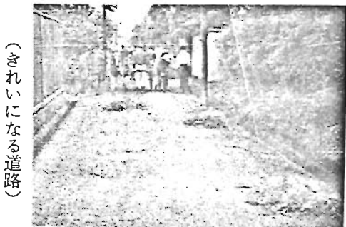
(きれいになる道路)

る少年達に正しい映画の見方を育てる一助となつたことと期待されております。 〇勤労青少年映画会 十一月二〇、二一、二二日、午後六時半より、於振興会館集会场 本運動のしめくくりの意味で継続的によい映画をみせる仕組を作るために 昭和三十一年度指定 衛生モデル地区の視察 本年度夏期衛生強調運動の成果を中心に街の衛生対策状況について衛生モデル地区の視察を十八、十九の両日実施し、終了後活潑且つ真剣なる批判会を開催しました。各地区とも熱心な衛生対策活動が展開せられており、衛生豊島完成への力強い歩みを感じられました。 なお、出席者は、区長、助役、民生課長、土木課長、自治振興課長、厚生委員長、地区委員長、モデル地区代表、伝染病予防委員長でした。