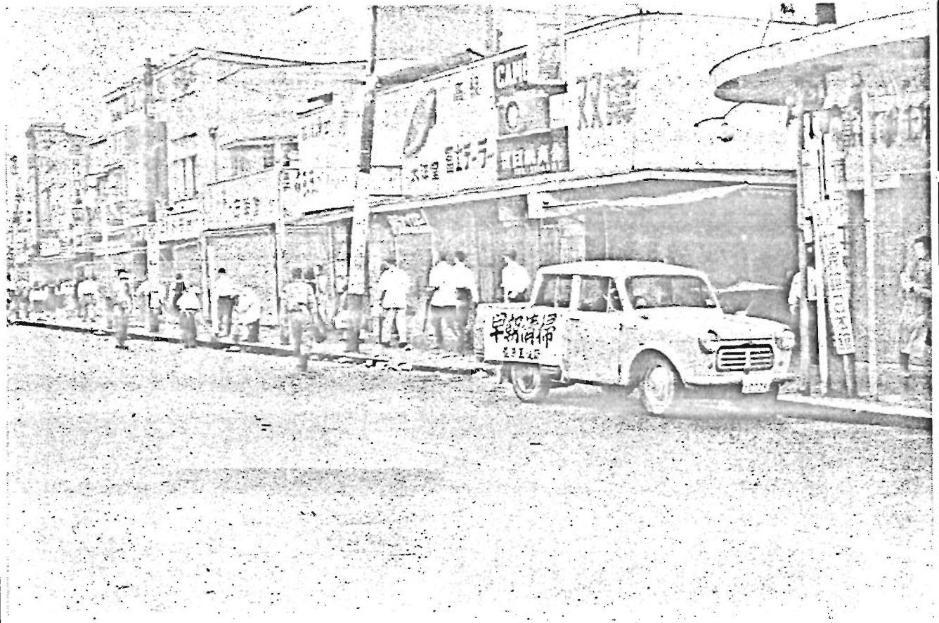
..... 清掃されたすがすがしい朝の舗道 .....