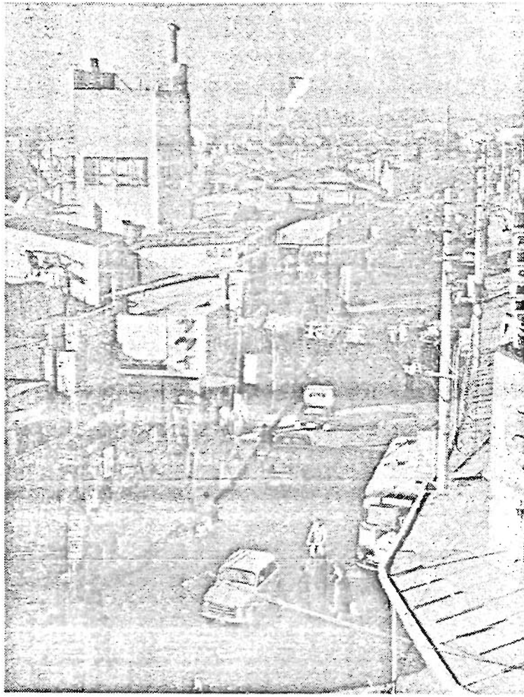
区割整理を急ぐ池袋西口