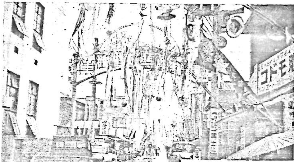
東鴨地蔵通りの名で知られた「七夕装飾コンクール」は画期的な繁栄策のあらわれと見ることができ、これは区内商店街の大きな前進の足音ともいえることができるでしょう。

こうした本区商工業の繁栄策に呼応する区内商店街の各種計画による発展策にも、目をみはらせるものが多く、殊に下の写真で見られるように七夕を迎えた