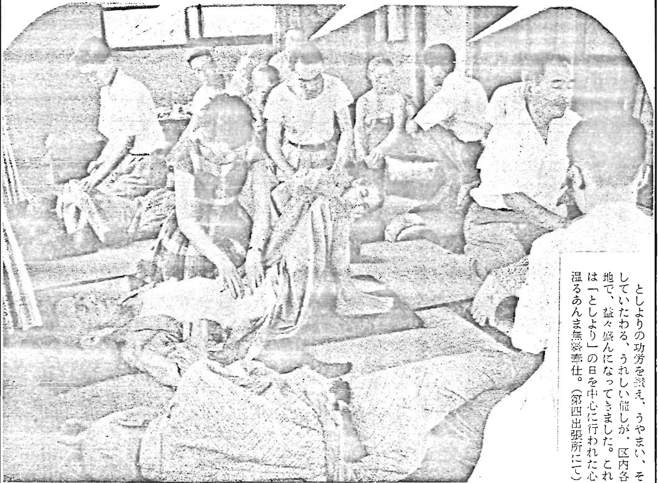
としよりの功勞を讃え、うやまい、そしていたわる、うれしい罷しが、区内各地で、益々盛んになってきました。これは「としより」の日を中心に行われた心温るあんま無料奉仕。(第四出張所に)