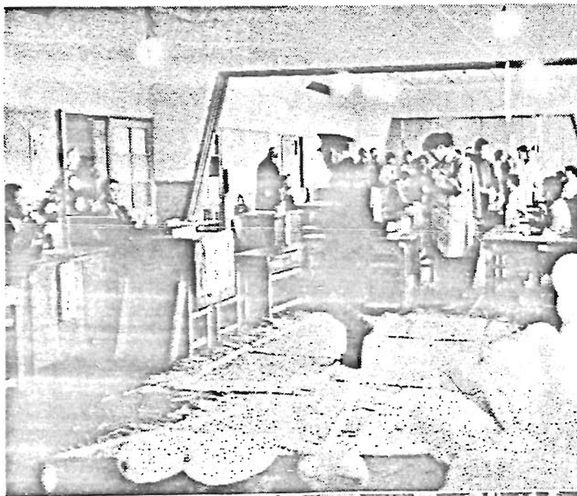
(下) 緊張のうちに開票は刻々進む