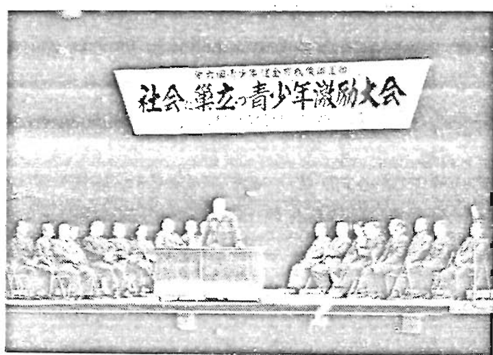
今春中学校を卒業し実社会で活躍する方たちの 前途を祝福し激励する大会が青少年問 題協議会の主催で2月26日豊島公会 堂で開かれました。

三月一日から三十一日まで は青少年健全育成強調運動実 施期間です。豊島区青少年問 題協議会では都青少年協と協力 し、わたくしたちの豊島区を 明るく住みよいところにする ため公德心の高揚をはかると 共に学年末をむかえ新たに実 社会へ巣立つ青少年及び働く 青少年に夢と希望を与えるた めに 青少年の公德心の高揚に つとめましょう 青少年に明るい職場と 学びの機会を与えましょう という主旨をかかげ多彩な行 事を実施中です。豊島区は池 袋という大きな盛り場をわか えております。次代を背負う 青少年を社会悪から守りすこ やかに育てるため区民の皆様 のご協力をお願いいたします