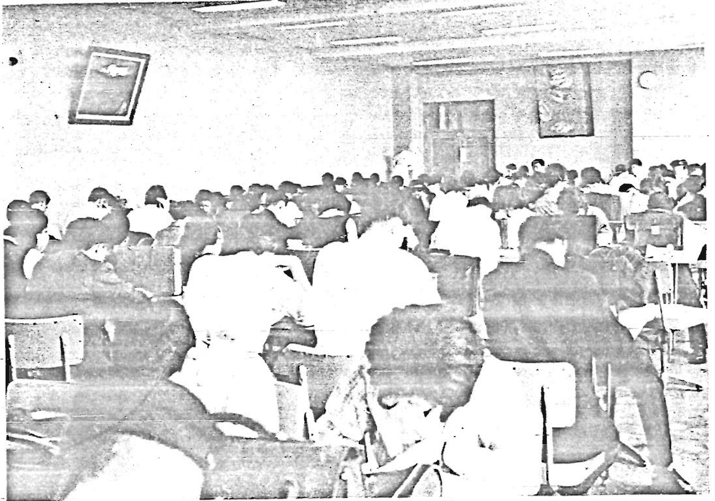
7時まで開館中の区立豊島図書館(記事4面)

発行所 豊島区役所 電話(971) (代)1101 (代)1166 昭和35年6月20日発行