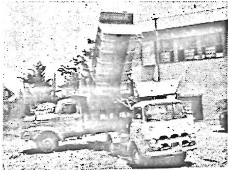
小型ダンブカーによる積替え作業