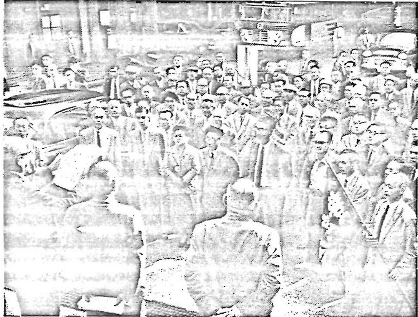
区長公選を都議会に陳情

△総合庁舎が建設され更に池袋東口町界地名地番変更により旧区役所位置が旧池袋一ノ六四二から池袋東一ノ一八となったためこれを明文したものの 日程第二 東京都豊島区役所の出張所設置に関する条例の一部を改正する条例案 △池袋東口の区画整理及び町界町地名番整理によって新設の池袋東一丁目は来る十一月一日から第二