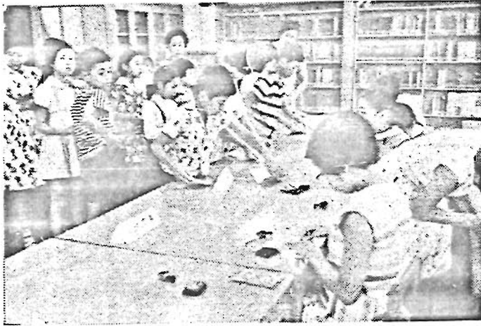
池一小 於いそがしい日貯

割が決められている。 銀行が開かれるのは毎月 第一・第三木曜日の始業前 の一時間で、この日には親 銀行から子ども銀行担当の 行員が集金のため来行し、 窓口の応待から現金の取扱 い、計算事務その他いろいろ と指導が行なわれている 銀行発足当初は預金高も 少なかったため、事務用品 などPTAの援助に頼って いたが、三十一年以降預金 高が大巾に伸びて昭和三十 五年には遂に二百万円を突 破、その後も順調な発展を