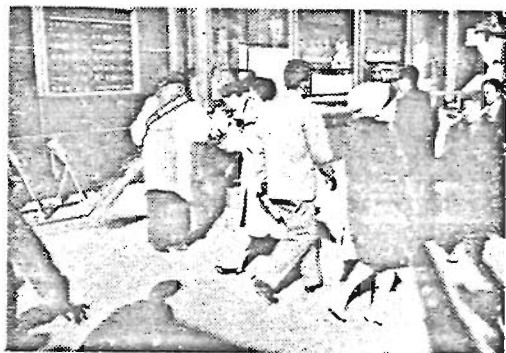
〜きれいにしましょう〜 私達のまち