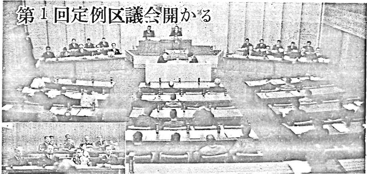
第1回定例区議会開かる

昭和37年第1回定例区議会が3月9日に招集され、同月22日まで会期14日間を開かれ、昭和37年度豊島区歳入歳出予算外6議案が提出されました。