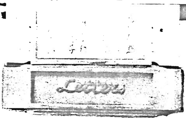
～ 表札はこんなふう～

手紙や小包がなかなか届かないということは、誰もが一度は経験していることと思います。またせっかく郷里のお母さまが送ってくれた「ふるさとの味」も日数が経ちすぎたために腐ってしまったとか、就職試験日の通知が試験日より遅れて届いたなど、どうも笑ってすまされない事件が起ったことさえあります。加えて夏季に入ると小包も手紙もぐんとその量を増してきます。また暑中見舞いのハガキもバカになりません。郵便局でもこれに備えて万全を期しておりますが、私たちとしても少しでも郵便屋さんや郵便局員の方の苦勞を助けるよう、協力しましょう。 ① 表札は見やすいところに、はつきりと、古いものには未練もありませんが、思いきって新しいものに変えてはいかが？ またアパートは全居住者の表札を出しましょう。 ② 安全に郵便物を受けとるために郵便受箱を必ずつけましょう。 ③ 郵便物を一度にたくさん出すときには、あらかじめ差出日時を郵便局まで知らせましょう。 ④ 郵便物の迷い子は全国で毎日約20万通もあります。あて名は省略せ