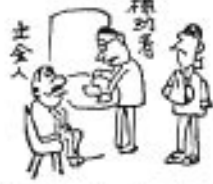
標榜者 秘書は厳守 字投票をしたい

身体が故や字が書けないために、自分で投票をすることができない人は、投票所において、代理投票の申し出をして下さい。この場合にも投票の秘密は厳守されます。