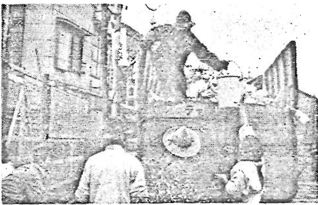
～ゴミ容器による定時収集作業～

○助成の取り消しと返還：申請書にいつわりの記入をした場合には、助成金を取り消されるか、返還させられることがあります。 なおわかりにくい点がありましたら区民生課か出張所まで――