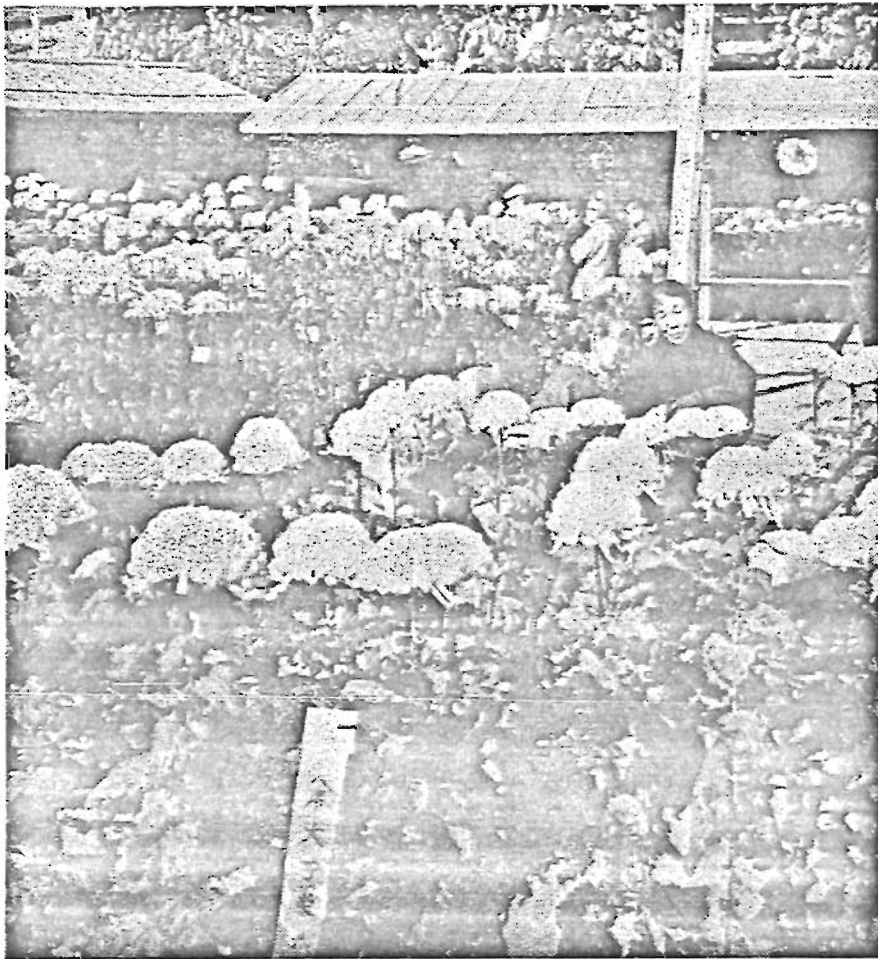
菊かおる季節をむかえ、豊島区と東京豊菊会では、11月1日から20日まで恒例の菊花展を中池袋公園で開いています。出品作品は大輪、盆栽、切り花など約350点です。秋のひとときをご観賞下さい。

昭和39年11月15日 東京都豊島区役所発行 電話 (981) 大代表 1111