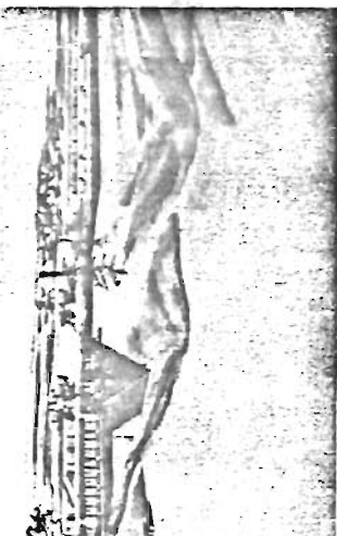
★ 改修完成後の高麗林田畑遊学センター想図

○近郊教育施設の拡充 38年に小学校低学年用として、開設した埼玉県入間郡日高町にある高麗林田畑遊学センターを、現在入間郡日高町にある高麗林田畑遊学の近郊施設の