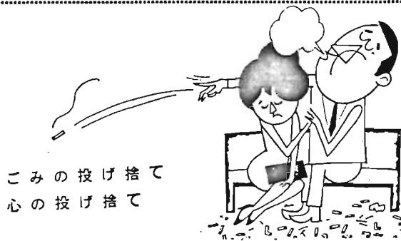
こみの投げ捨て 心の投げ捨て

人間はだれでも、自分たちの生活環境がよごれているより、清潔であることを望んでいます。しかし、私たちは無意識のうちによごしているようなことはないでしょうか。人間の生活によごれはつきものとはいえ、そのまま放っておいてよいわけではありません。よごれの要素はちょっと注意さえすればなくすことができます。私たちの町東京を、いつもきれいにしようお互いに心がけましょう