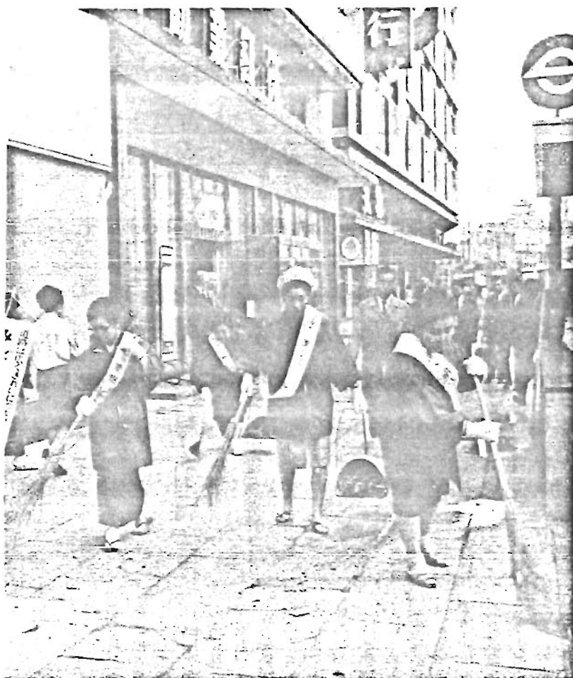
〔写真〕10月5日から始まった「東京をきれいにする週間」に、池袋東口前を清掃する地元の人たち。

世帯と人口 9月1日現在 人口 338,948 男 169,960 女 168,988 世帯数 130,741 (住民登録による)