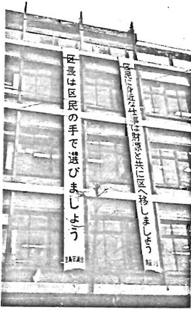
写真 総合庁舎に掲げられた自治権拡充のためのたれ幕

それには、雇主や職場の先輩が、つとめて少年たちとふれ合い、気持を理解し、仕事のことはもちろん、余暇の過ごし方などについても気を配り、健全な