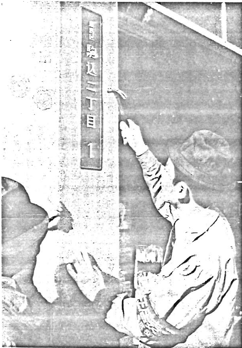
〔写真〕国電駒込駅に取り付けられた「みどりの表示板」

昭和43年11月20日 発行 豊島区役所 編集 区民部区民課広報係 豊島区東池袋1-18-1 大代表(981)1111