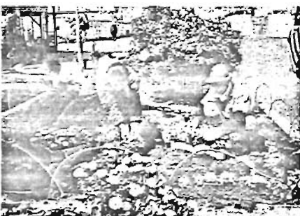
花壇のお化粧直し 美しい草花でいっぱい

お待ちせしました 千早保育園が6月2日開園 かねてから工事をすすめていた千早町の三八区立千早保育園がこのほど完成6月2日に開園します。区立保育園では一四番目のもので、もうすぐ可愛い園児たちの歌声が聞こえてくることでしょう。