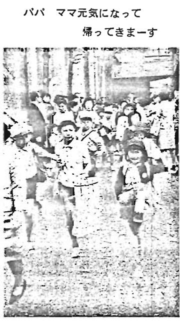
パパ ママ元気になって帰ってきまーす

ご存知ですか？ 消費者の利益を守る 消費者の利益を守るために昨年五月「消費者保護基本法」ができました。東京都も区も、良人、売人も、商品とマナーの向上につとめなければなりません。 しかし、消費者の利益を守るのには、やはり消費者自身、つまりお買物をするあなたなのです。知識をふやし、工夫をこらして生活の向上につとめましょう。