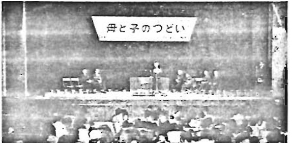
花束交歓に大きな拍手 楽しかった「母と子のつどい」

は、葉団でクモの巣状の巣をつくり、葉の片面だけを食害します。葉をみついたら枝葉をきりとり焼くか踏みつぶしてください。発見がおくれ幼虫が各枝にひろがった場合には、薬剤散布などによる駆除方法しかありません。一般の家庭で手におえないときは、電話でご連絡ください。公園工事事務所 昭二六五四か公園管理係(内線26)へ。