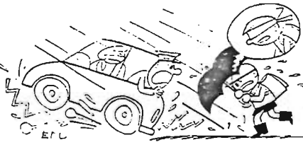
雨の日にご注意 この中にも注意 いっしょに歩こう