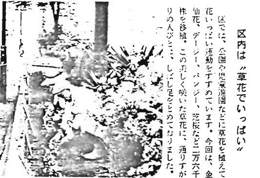
区内は「草花でいっぱい」

区では5月5日、豊島公会堂で「母と子のつどい」を開きました。この日区長さんたちのお祝いのことはご存知で、「おかしさんこんなに大きくなりました、どうもありがとう」「いつまでもおこさんにしてネ」と花束の交歓に議員の会場から大きな拍手がわきました。