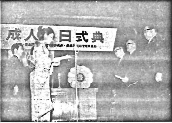
成人の日式典... 今年を振り返り、来年を期す。