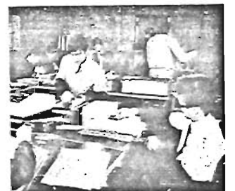
(写真) 選挙人名簿の作業をいそぐ選挙管理委員