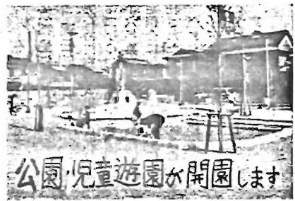
公園児童遊園が開園します

豊島区は副都心地帯を抱えて戦後一大発展を遂げた商業地区で、人口密度においても都内のトップを争っております。