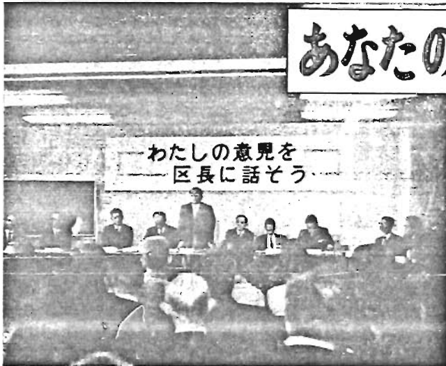
〔写真〕11月21日、目白1丁目の目白厚生会館で開かれた初の「日曜対話集会」

区では、区民の方から寄せられた貴重な意見、ご要望を十分に参考として、今後の区政運営に役立てたいと考えています。催された初の対話集のあらまは、次のとおりです。