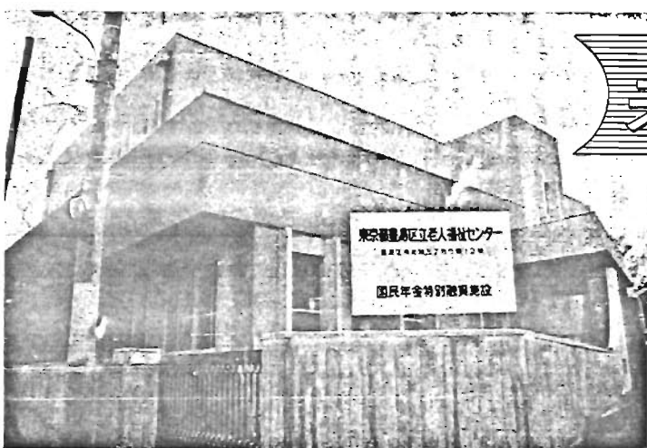
完成まじかな区立老人福祉センター

区民相談室に お立ちよりください。 区民のみなさんが、区政についてのご意見、ご要望、苦情、問合せなどを気軽に持ちこめる相談室です。 受付は、執務時間中です。 どうぞご利用ください。 電話 (981) 1111 内線472・475