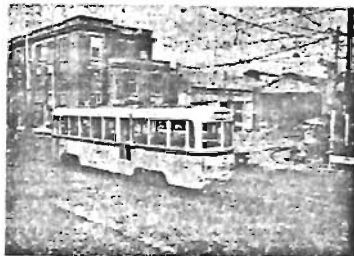
昨年三月かざりて姿を消した大塚・都電車庫

東京都交通局の「都営交通事業財政再建計画」で、都電十六系統(大塚駅前一本所一丁目)が昨年春大塚駅前からその姿を消しました。 大塚は、戦前は東武の「とげぬき地蔵尊」となっていて、駅前の天祖神社と、当時区内では唯一の「デパート」であった大塚白木屋デパート付近を中心として賑わっていました。そして池袋をしのぐ山手屈指の繁華街の一つとして、学生や買物客に親しまれていました。 戦後になると、駅前の戦災復興の土地整理事業のたろお