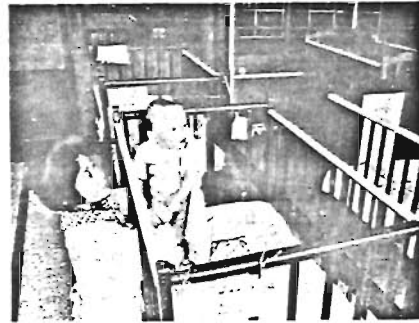
東池袋に乳児室オープン

▽精神薄弱児で「愛の手帳」の1・2・3程度程度の児童 ▽身体障害児で「身体障害者手帳」の1・2・3程度程度の児童