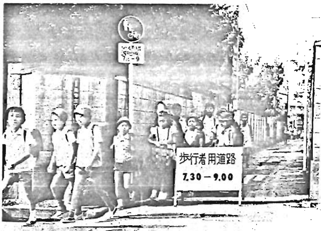
スクールゾーンの設置で事故件数が大幅に減少。

しましよ。また、おとしよりの事故で一番多いのは、横断してはいけない場所を横断したり、横断方法が悪いのが原因となつていますが、おとしよりに関しては、正しい歩行と、自転車利用を重点として街頭指導・老人クラブ活動などの機会を利用して安全指導を推進したり、警察官がおとしよりの家庭を訪問し、事故防止の指導を行ないます。