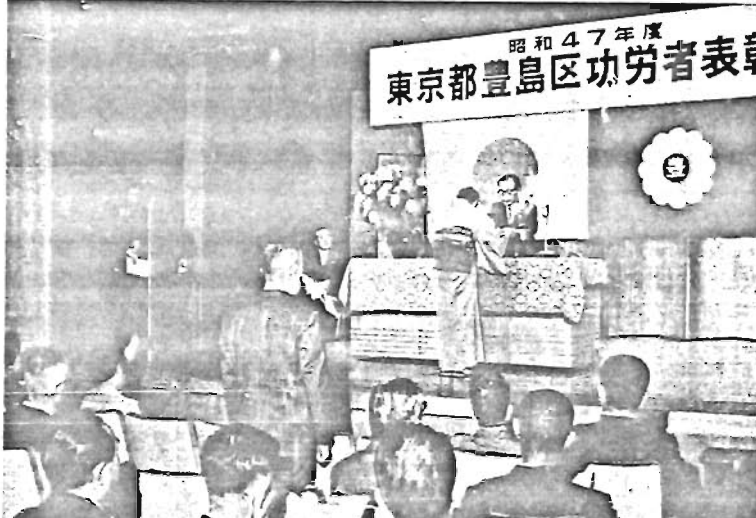
昭和47年度 東京都豊島区功労者表彰