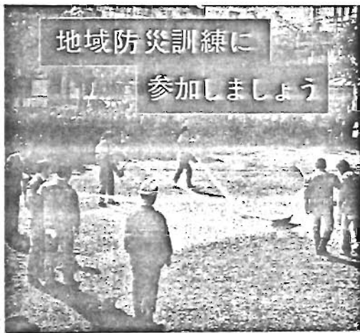
地域防災訓練に 参加しましょう 地震で一番おそろしい火災。この火災も初期のうちに消すことが肝心、日頃から訓練をうけておけばとっさのときにあわてずにすみます。

豊島区では、昨年一年間で二百九十三件の火災が発生し、その損害見額は、三億二千五百五十万円に達しています。こうした火災は、まず出さないことに限るわけですが、出火した場合でも早く気づき、手もとにバケツの水や消火器などの消火器をいっしょに火災といわれてい