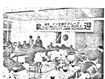
グーテン・ターク(コンニチワ)々 西ドイツから青少年が来庁 10月5日、訪日西ドイツ定期交歓F班23名が来庁。ただちに会議室で区長、議長らが出迎え歓迎会がもたれました。このグループは、日本の文化、歴史、教育などを自らの目で学ぼうと来日したもの。両国の国旗と歓迎の横断幕の下で、豊島区の「世界青年友の会」会員たちとなごやかな交歓会が行なわれ、席上区長からおみやげをもらって大喜びでした。

11月は 市民総ぐるみの 公害監視 ゴミの不法廃棄! 不法 駐 車! 迷惑な騒音! 公害監視強化の月 青少年育成活動に 補助金を交付します 秋はなんといってもスポーツ など体力づくりの季節です。 体育の日、文化の日、勤労感 謝の日など日曜日にあたらない 休みの日が多くあります。 スポーツ大会や野山にハイキ ングやビクニックなど各地で行 なわれるのもこの時期です。 区ではこうした行事を計画し ている主として青少年を対象と したグループや団体に補助して おります。 申請先 地区青少年育成委員会 (区役所出張所内) お問い合わせは、区役所厚生部管 理課青少年係(内線314)へどう ぞ。