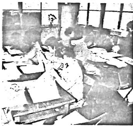
明るく育つ「さくらの家」 45年11月に開所した。心身障害者の福祉施設「さくらの家」は、いま生きる喜びを身体に表現するよう、明るく花を咲かせています。〔写真〕軽作業風景

区では、心身に故障があるため寝たきりの状態にあるおとしりに、病苦を慰め、経済的負担を少しでも軽減していただくため、昨年十一月一日から月額三千円の福祉手当を支給していましたが、四月一日から月額五千円に引きあげられます。なお所得制限が撤廃になりましたので、次の要件に該当されて、まだ手続きをしていない方は、申請してください。 ◎区内にお住まいの満六十五歳以上の方で、 ①寝たきりの状態が六か月以上になり、なお、その状態が継続するものと認められること。