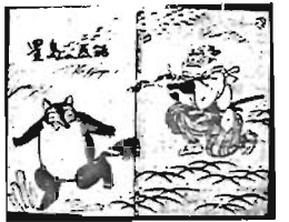
一刊行なつた「豊島の民話」一