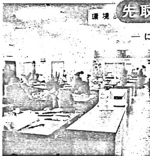
—新築なった環境部事務室— (板橋会館一階)

社会変動の著しい今日、区行政に対する需要は、ますます増大し、その質的な要求は高度化しております。 このような情勢の変化に対して、区では、組織の効率的な改善により、住民福祉の増進をはかるために、この度、部課の新設廃止の組織改正を行いました。