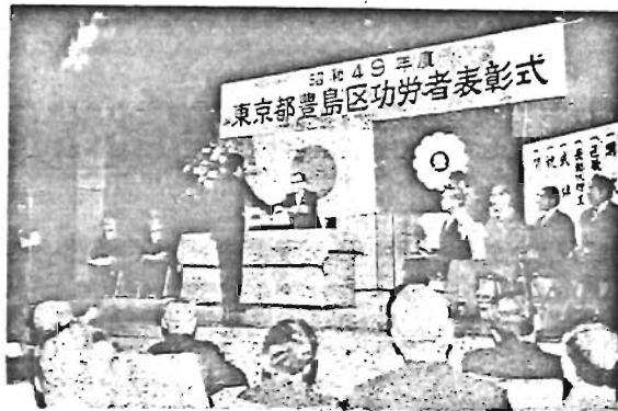
—表彰を受ける区功勞者—