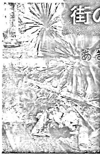
投げ捨てられたあきカン

あきカンは、どのようにして捨てられたのでしょうか。あきカンを買った人の何割が、くすかごの中にカンを入れて、何割の人が、くすかごに入らずに「散らし捨て」をするかを調査した結果は、図のとおりです。