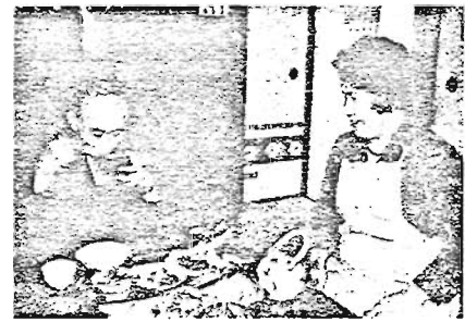
【おとしり】 今日を楽しみにしていましたヨ…… 【給食協力者】 おじいちゃん…次のとき、何にしようかしら…