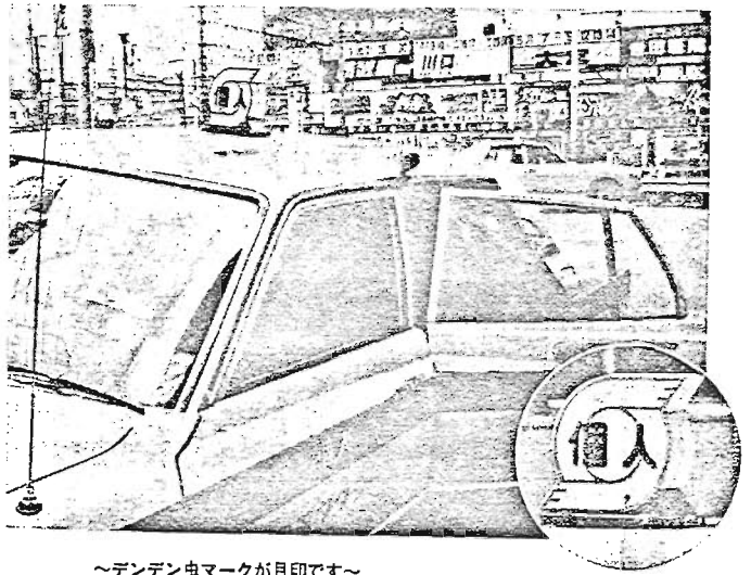
～デンデン虫マークが目印です～

豊島区では、身体障害者の方の生活の利便を図るために、6月1日から福祉タクシー制度を実施します。 この制度は、東京都個人タクシー協同組合と協力して行うもので、身体障害者の方が自宅にタクシーを呼んだり、街頭でタクシーを拾うことが気軽にできるようになります。