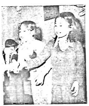
ケン玉検定(東横児童館にて)

●南長崎第一児童館と南長崎第二児童館は、5日(子どもの日)も開館します。 ●南長崎第一児童館 児童館 950-3042 △5日開館します▽13日2時半 「わかばまつり」バンド演奏とふうせんを飛ばします▽16日3時「子どものハッピーキャッチング教室」モデル募集▽金曜日「本の貸出し」ただし、26日を除く ●南長崎第二児童館 957-6376 △5日1時半「子どもの日ミニ運動会」