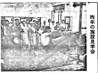
昨年の施設見学会