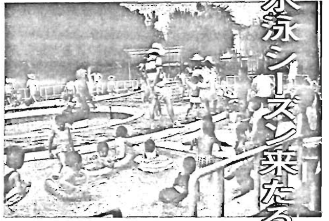
—水の事故に注意しましょう—

・水泳中は身体が冷えるので、長い時間水に入らず、適当な時間で水から出ること。 ▽泳いだ後は ・必ずきれいな水で目を洗い、うがいをし、シャワーで身体を洗って整理運動をすること。 ・水泳によって感染しやすい病気には、目・耳・鼻・皮膚に症状が出るものが多く、身体に変調があったら、すぐ医師に診察してもらいましょう。