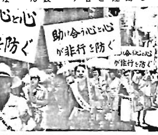
犯罪防止の啓発活動の様子

この運動は、関係機関、各団体、地域住民が力を合わせて、非行を誘う社会的要因を取り除き、非行に陥った青少年の更生を促かく助