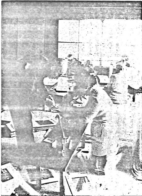
作業をする高齢者事業団会員のみなさん