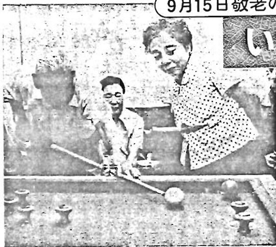
元気にバンパーを楽しむお年寄りたち(老人福祉センターにて)

9月15日の「敬老の日」を記念して、区では、今年も老人福祉週間を中心に、お年寄りの方を慰安、激励するため、多彩な催しを行います。 長い間社会のために尽くされ、ご苦労を重ねてこられたお年寄りを敬愛し、その長寿をお祝いするこの催しに、一人でも多くの方が参加されるようお待ちしています。