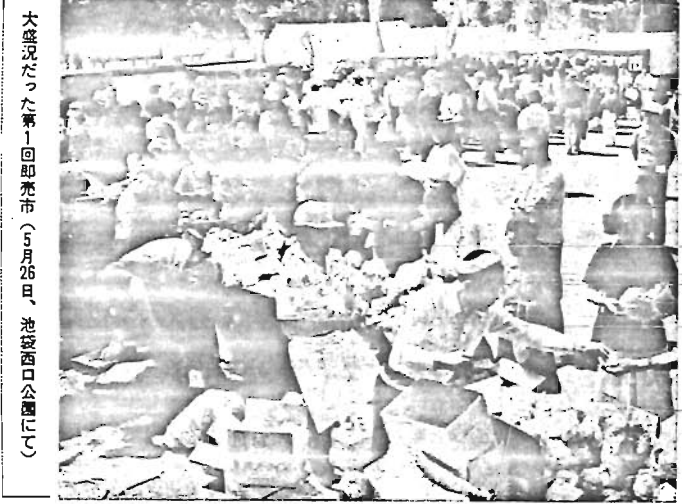
大盛況だった第1回即売市(5月26日、池袋西口公園にて)