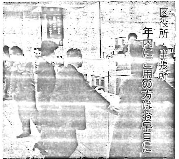
区民役所出張所 年内にご利用の方はお早目に