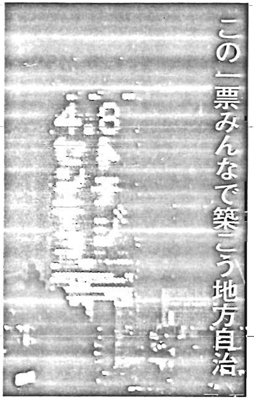
この一票みんなんで築こう地方自治