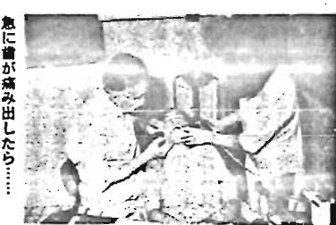
豊島区歯科医師会館 (南大塚2-37-1)