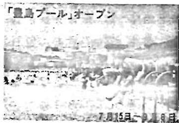
「豊島プール」オープン

◇詳細：開場前は豊島体育館910-1701、開場中は豊島プール910-2226へ。