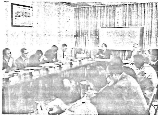
6月15日に開かれた第1回水害対策協議会