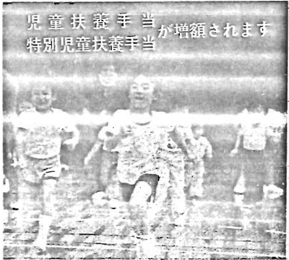
児童扶養手当が増額されます 特別児童扶養手当